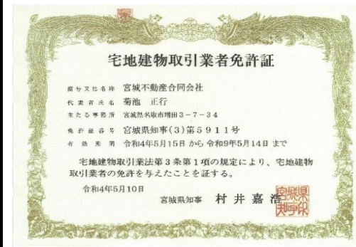
宅地建物取引業者免許証