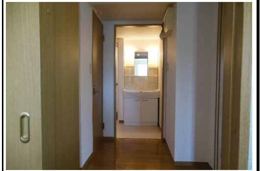
洗面台とシャンプードレッサー