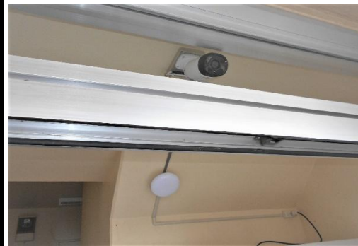
エントランス監視用カメラ