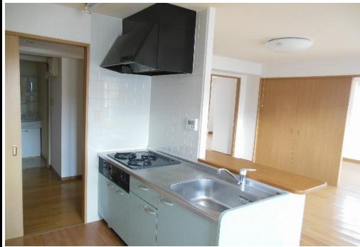
キッチンとリビング