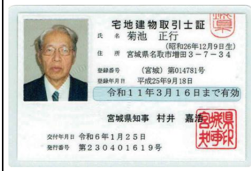
宅地建物取引士証