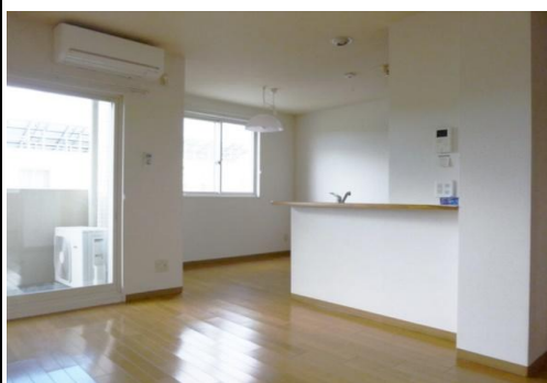
リビングと対面キッチン