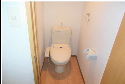
ウォシュレット付きトイレ