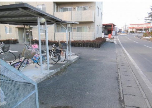
駐輪場と敷地内ゴミ置き場