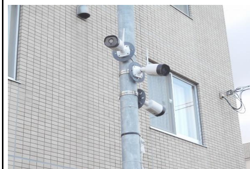
道路側監視用カメラ