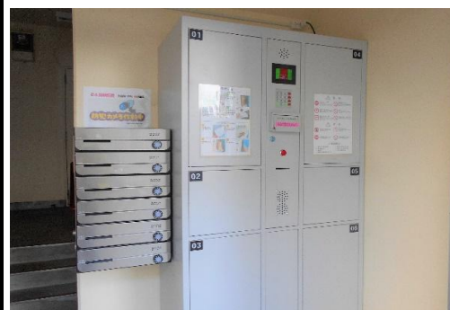
宅配便ボックスと郵便受け