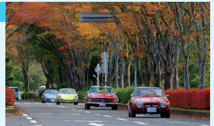
▲紅葉の下を走るクラシックカー。どの車もカッコいい！

川崎町もikuto（旧川内小学校）が立ち寄りスポットになっており、みちのく湖畔公園の前を通過し、多くのクラシックカーやスーパーカーが町内を走り抜けました。