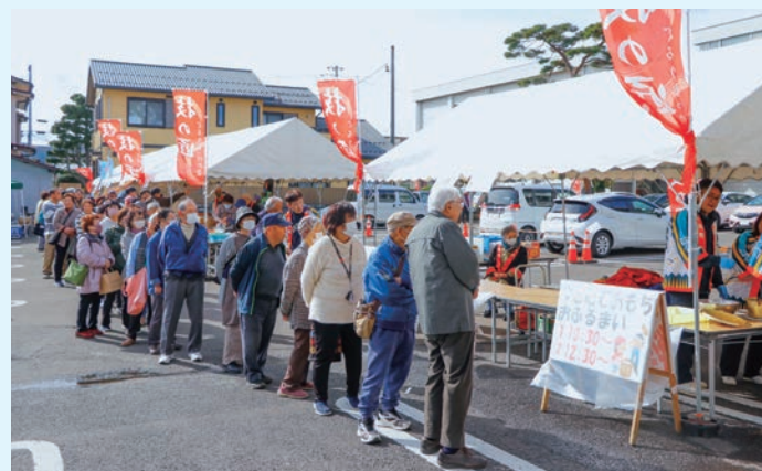
▲つくたての餅を楽しみに待つお客さんたち