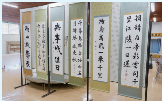
▲どの作品も繊細でつい見入ってしまいます