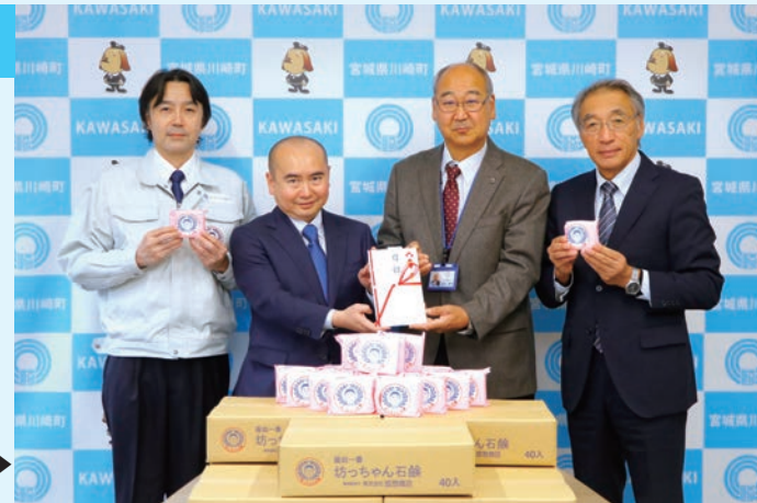
左から、諸伏取締役工場長、畑代表取締役、大沼副町長、相原教育長