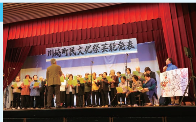
▲シニア大学の皆さんによる合唱

また、ステージで行われた芸能発表では、団体や個人の方による歌や舞踊、楽器演奏など20件の演目が披露され、会場に集まった約300人のお客さんを魅了しました。