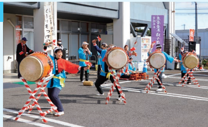
▲オープニングは支倉豊年踊りで

また、株式会社百の皆さんによるつくたて餅の振る舞いも行われ、長い列ができていました。ほかにも、地域おこし協力隊やキッチンカーなどが出店し、会場は多くの人で賑わっていました。