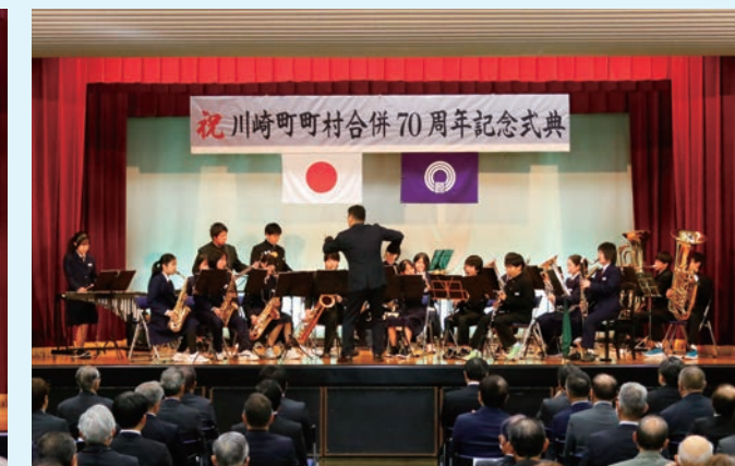
▲川崎中学校吹奏楽部の皆さんが会場を盛り上げました