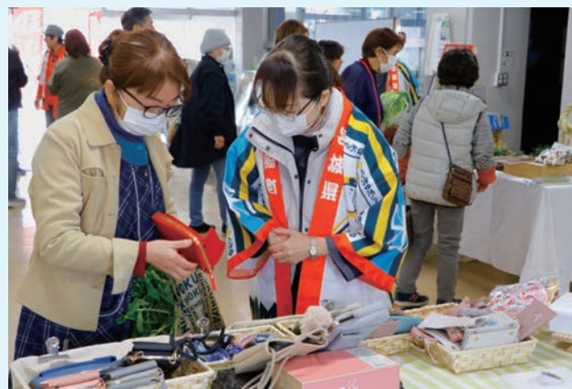
▲どれも素敵な作品ねえ