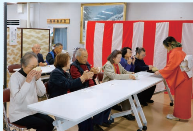
▲大好評だったお茶会