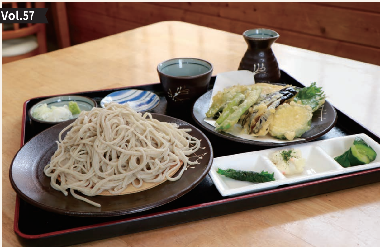
写真は、野菜天ぷら寒ざらしそば。税込1,700円