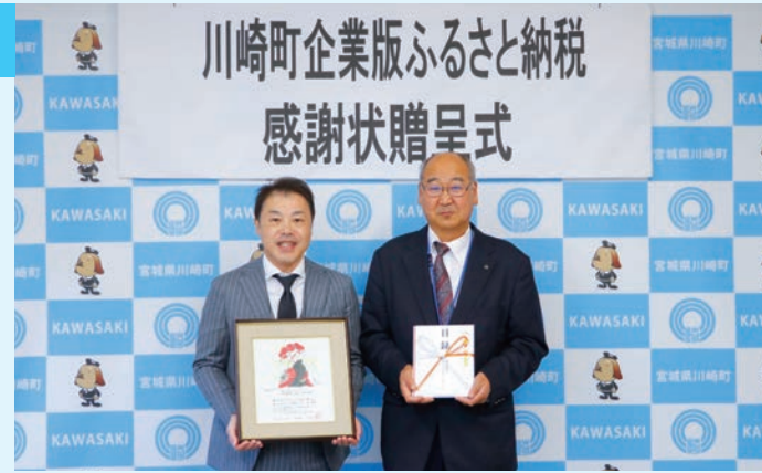
▲左から、納庄代表取締役社長、大沼副町長

株式会社ビルワーク・ジャパン様は、今回で2回目の川崎町への寄附となり、納庄代表取締役社長は、「医療の充実のために活用してほしい」と話していました。医療や福祉の充実のために活用させていただきます。