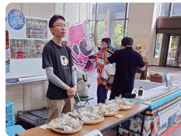
▲県庁の販売会で、スライスしたしいたけを販売しました

*露地栽培とは、屋外の自然環境を活かして作物を育てる農法です。ハウスなどの人工設備を使わず、季節や天候に合わせて栽培します。