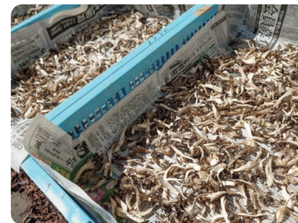
▲乾燥中のしいたけ