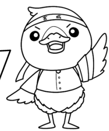
みやぎハローワークキャラクター 「ガンちょーさん」