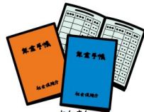
ねんきん 年金 Pension